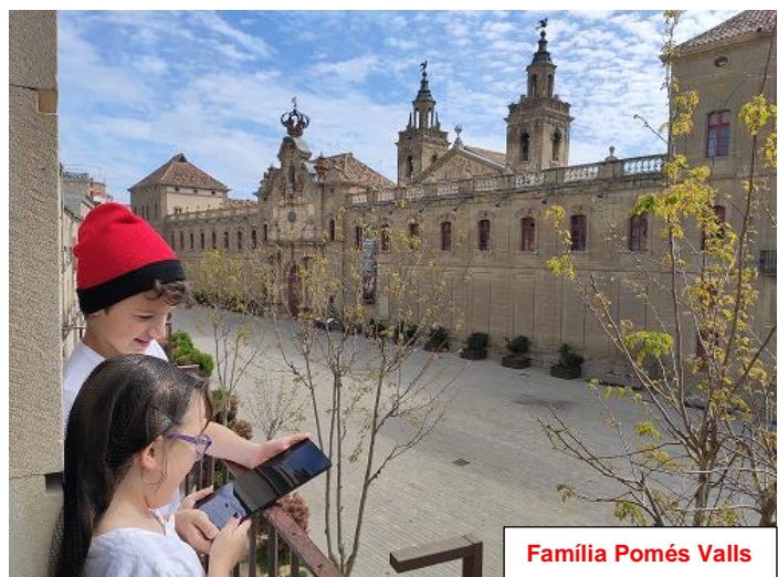
Família Pomés Valls